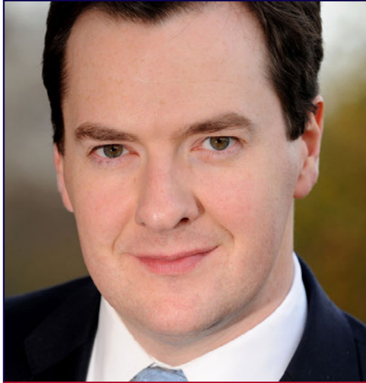
جورج أوزبورن وزير الخزانة