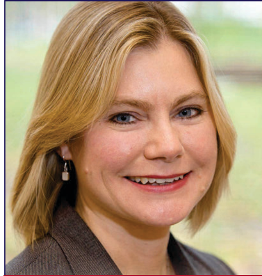
جستين غرينغ وزيرة التنمية الدولية