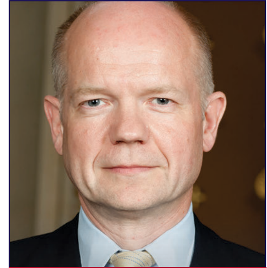
ويليام هيغ وزير الخارجية

يمثل الربيع العربي فرصة تاريخية لشعوب منطقة الشرق الأوسط وشمال أفريقيا لبناء مجتمعات أكثر استقراراً وازدهاراً وشمولية، وتستند إلى أسس الديمقراطية.